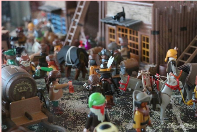
Fuerte Pasquinel by Conde de Roscapilla