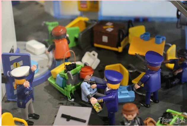
Secuestro en el aeropuerto by Berserker