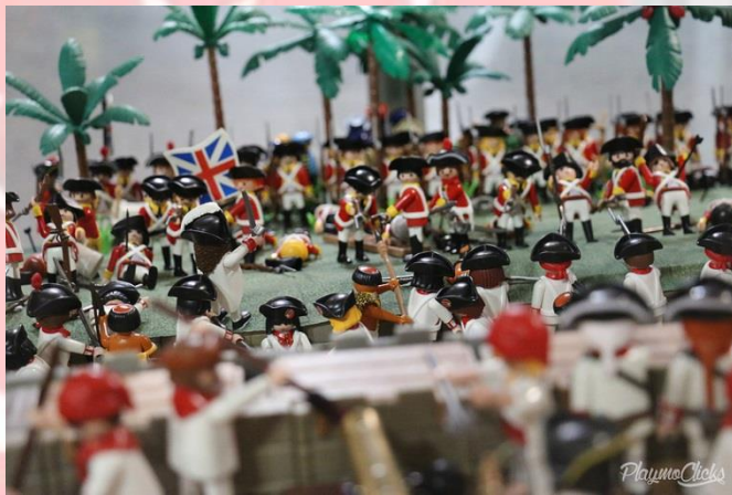
Cartagena de Indias by Goliat, Martín y Cabezatablón