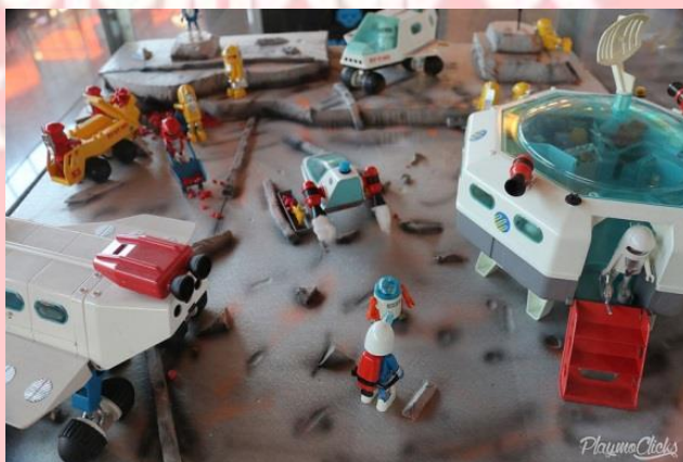
La conquista del espacio