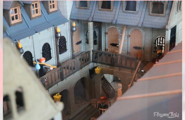
Abadía Medieval by Pedro