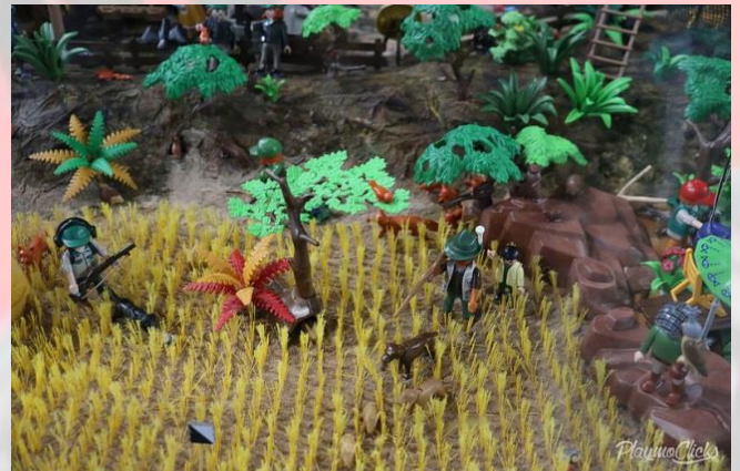
Caza Menuda by Parlilleskano