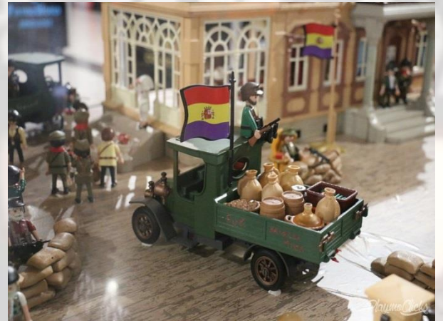
Madrid Otoño 1936 by Martin